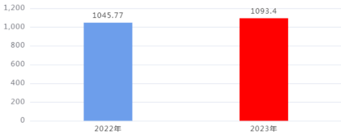
财政拨款收、支决算总计变动情况图（单位：万元）

2023年度财政拨款收、支总计1,093.4万元。与2022年度相比，财政拨款收、支总计各增加47.63万元，增长4.55%，主要是：本年度业务开展量有所增加。