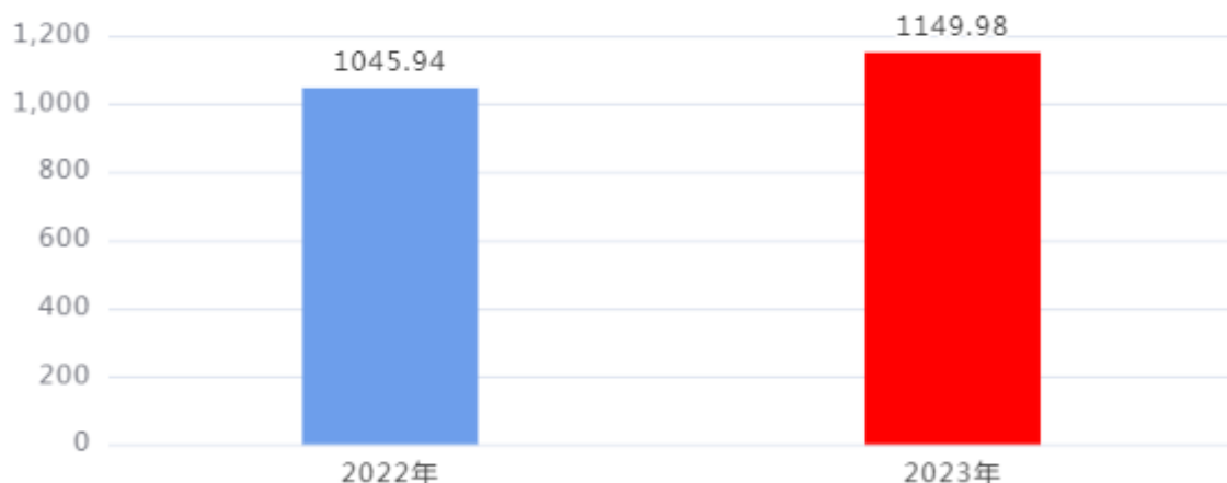
收、支决算总计变动情况图（单位：万元）

2023年度收、支总计1,149.98万元。与2022年度相比，收、支总计各增加104.04万元，增长9.95%，主要原因是：本年度业务开展量有所增加。