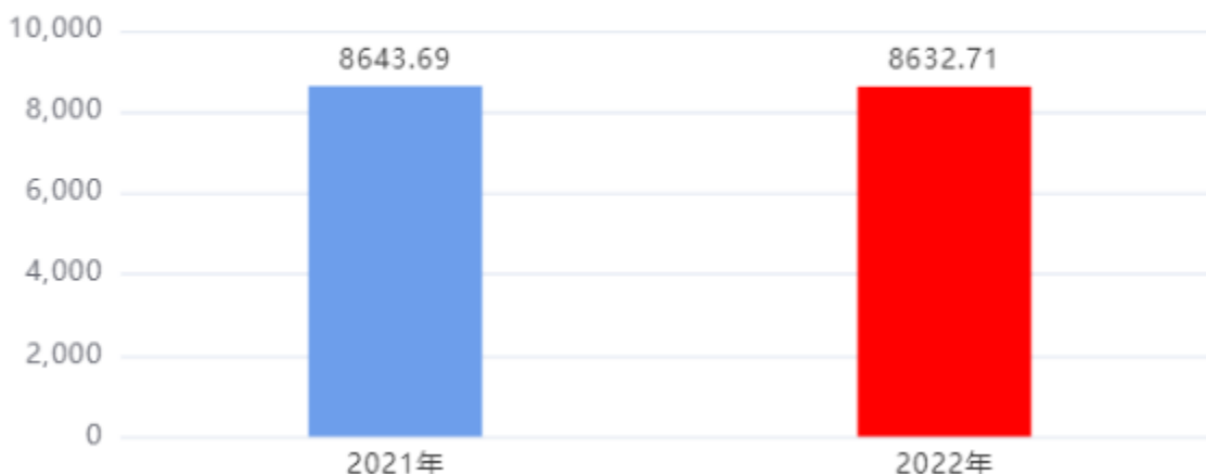
一般公共预算财政拨款支出决算变动情况图（单位：万元）

2022年度一般公共预算财政拨款支出8,632.71万元，占本年支出合计的100.00%。与2021年度相比，一般公共预算财政拨款支出减少10.98万元，下降0.13%。主要是基本持平。