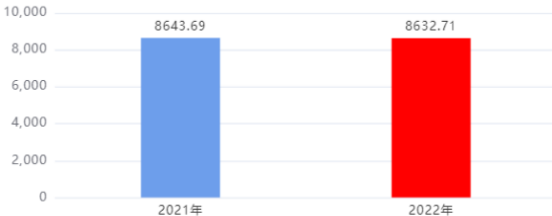
财政拨款收、支决算总计变动情况图 (单位：万元)

2022年度财政拨款收、支总计8,632.71万元。与2021年度相比，财政拨款收、支总计各减少10.98万元，下降0.13%。主要是基本持平。