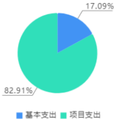
本年支出决算结构图

本年支出合计8,632.71万元，其中：基本支出1,475.30万元，占17.09%；项目支出7,157.41万元，占82.91%。